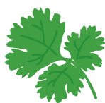
PHAKCHI パクチー(コリアンダー)