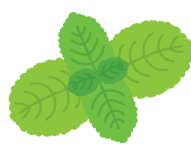
PEPPER MINT ペパーミント