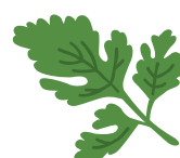
ITALIAN PARSLEY イタリアンパセリ